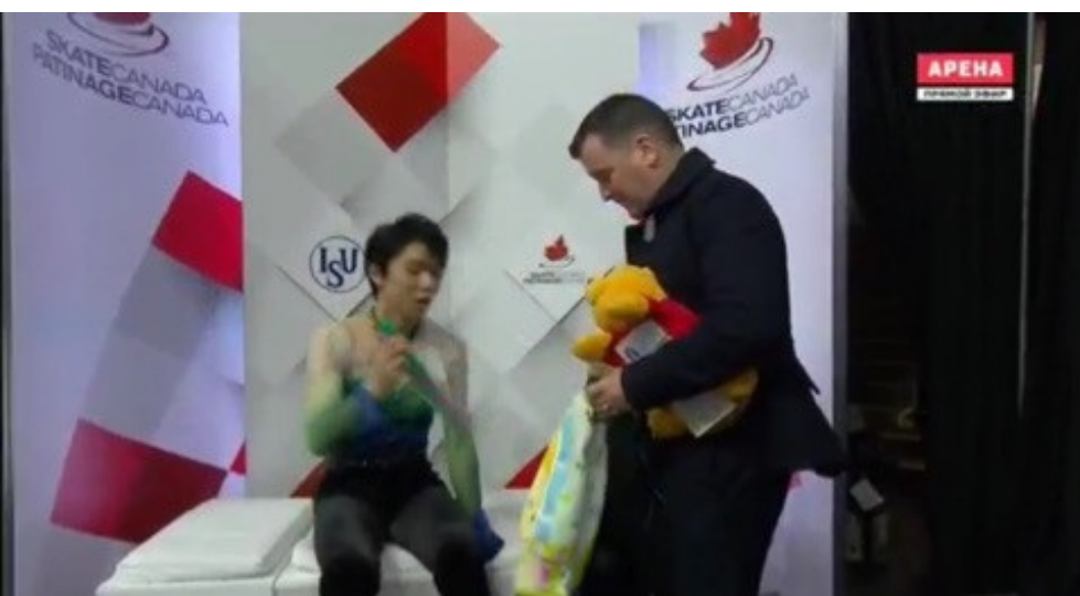
「なんだよ この間わざと削除したの まだ怒ってんのか」