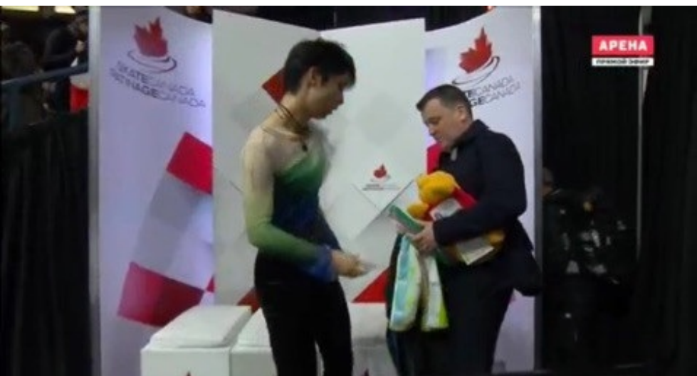
「親分 HDDの録画のことですけど」