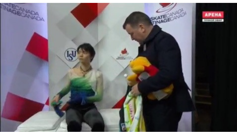
「いやそうではなく」