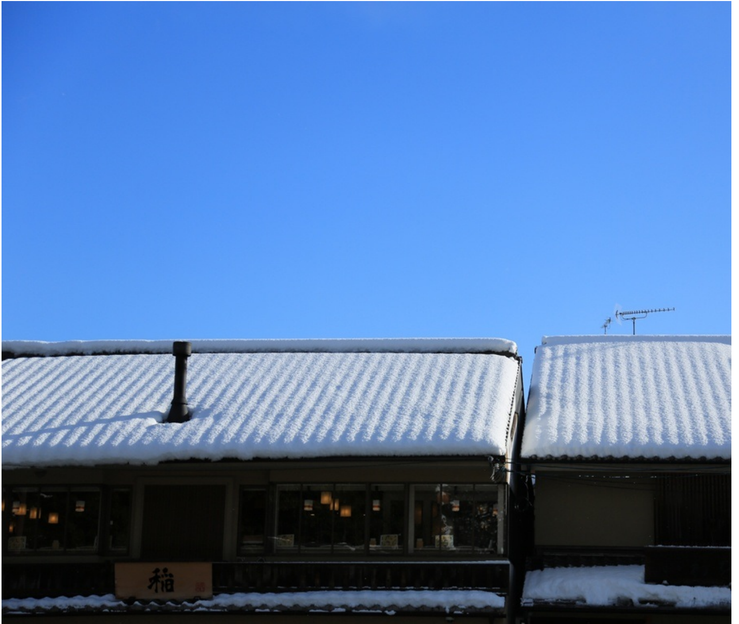
天龍寺の石庭みたい。