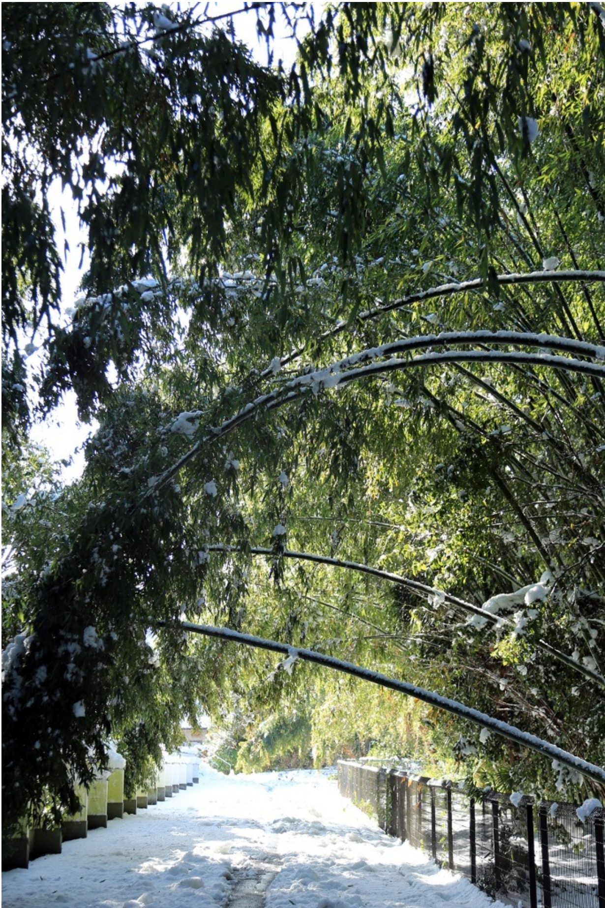
竹に雪折れなし、、、あれは柳か。