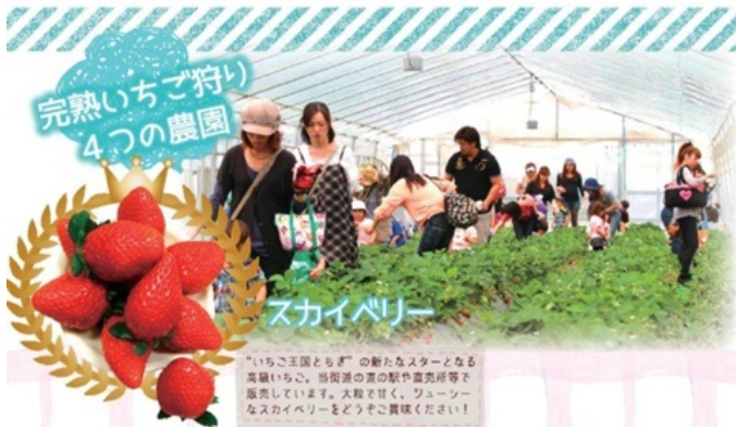
「いちご王国とちご」の新たなスターとなる高級いちご。当街道の道の駅や直売所等で販売しています。大粒で甘く、ジューシーなスカイベリーをどうぞ貴味ください!