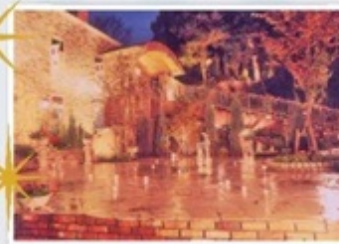
道の駅どまんなかたぬま/6月の森/あしかがフラワーパーク