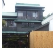
会田他家モデルハウスに決定w