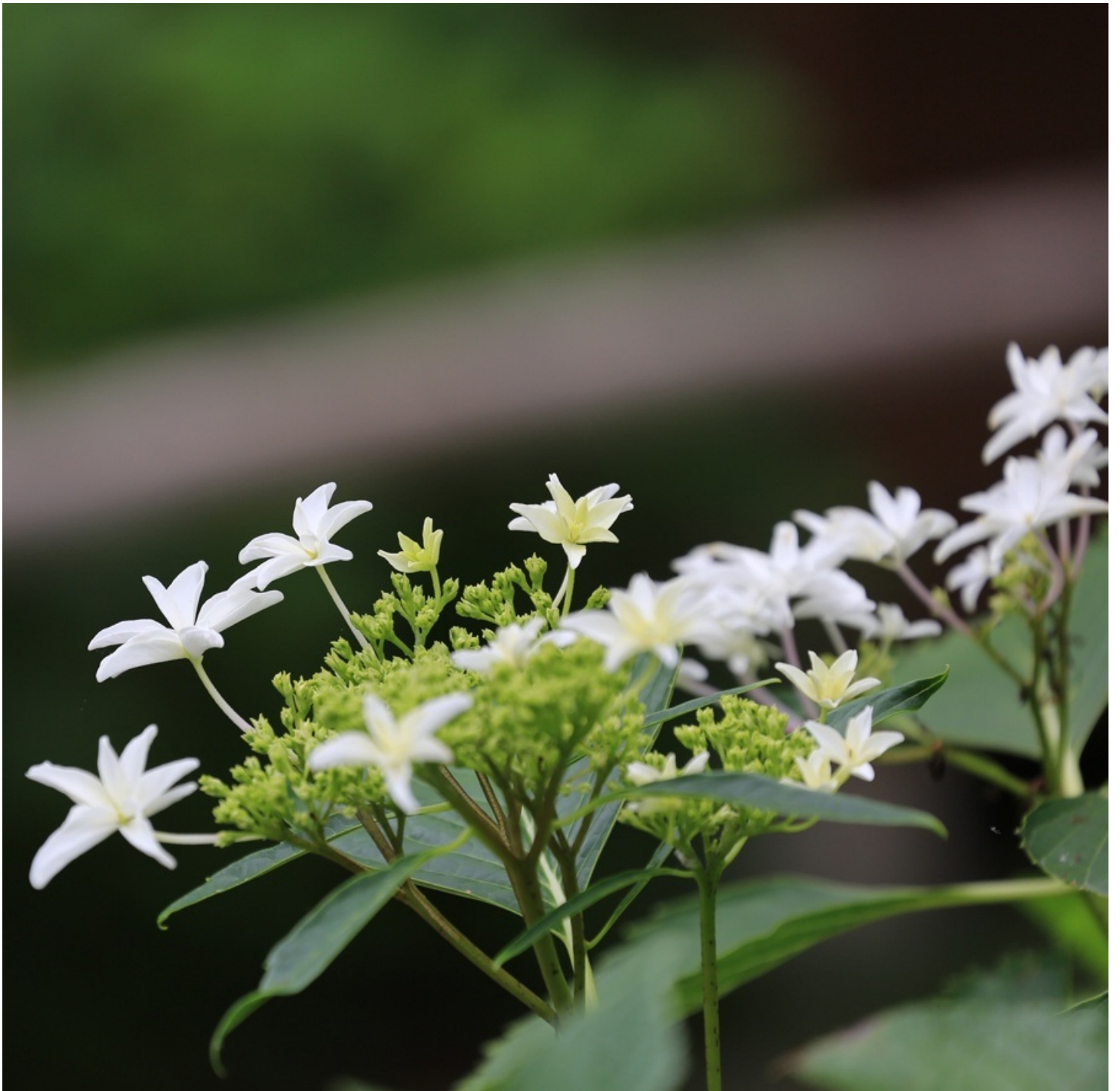
紫陽花は大きくなるのでベランダで育てられないのが残念。