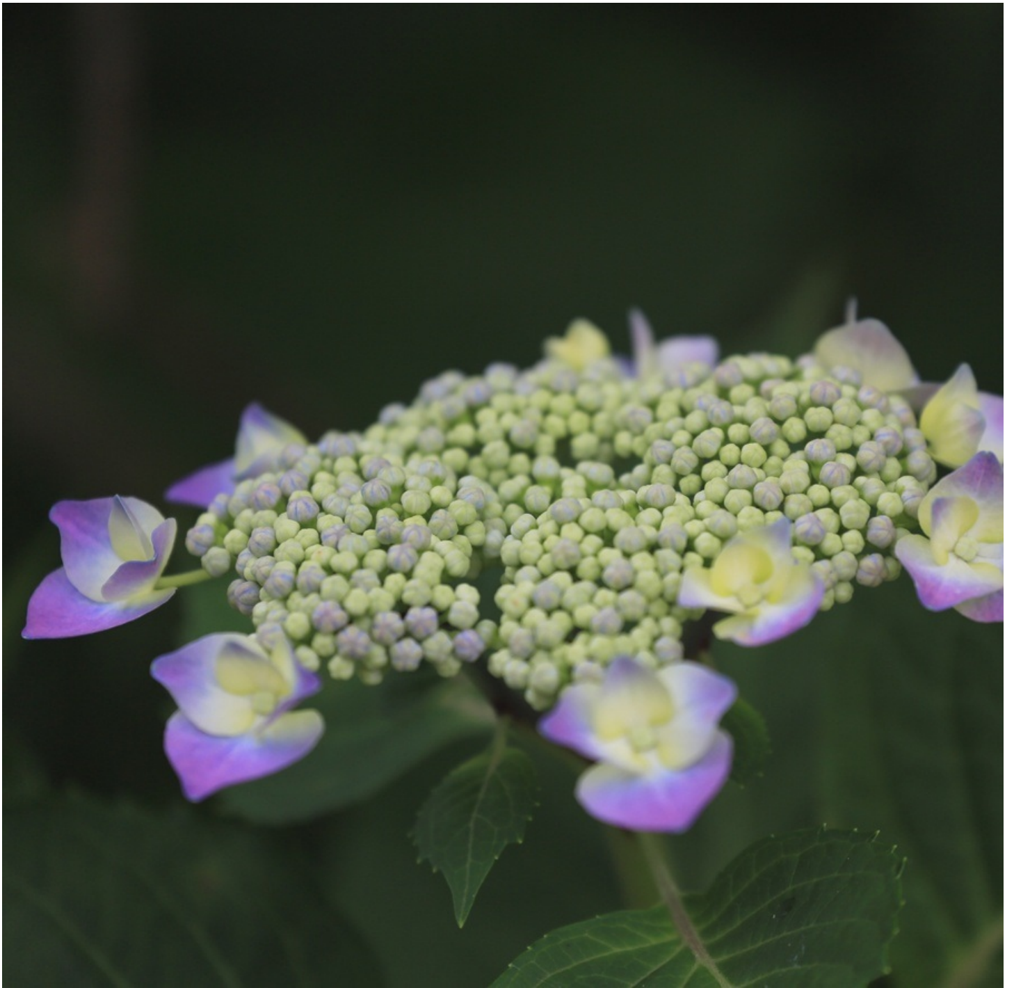
ちっちゃんのが手毬麩みたい。