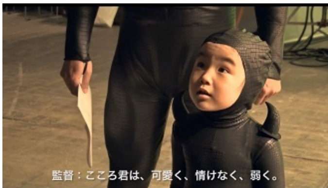
監督：こころ君は、可愛く、情けなく、弱く。

■マスコミ芸能界という異臭空気の中で基礎工事のできてない子どもがズレたことをやっているようでは、将来奇病難病に罹ってもおかしくはない。