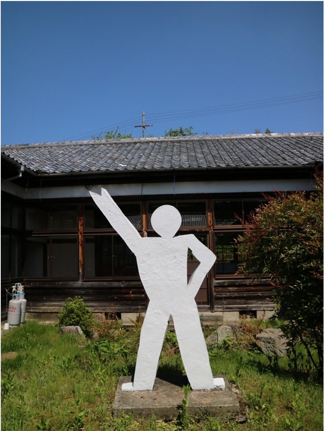
ジョン・トラボルタ