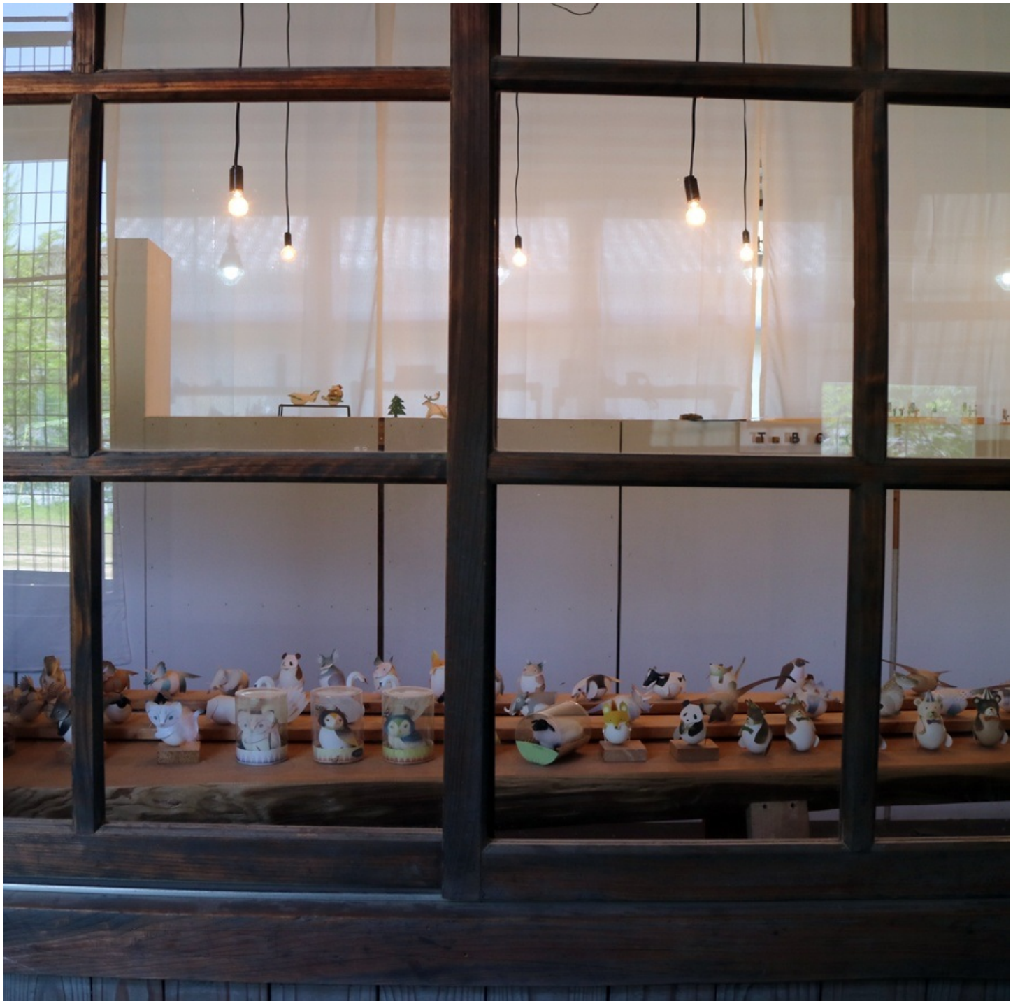
別室にはこんな可愛い紙のおもちゃが。 ゆらゆら揺れるそうですが、売る人が居ない。