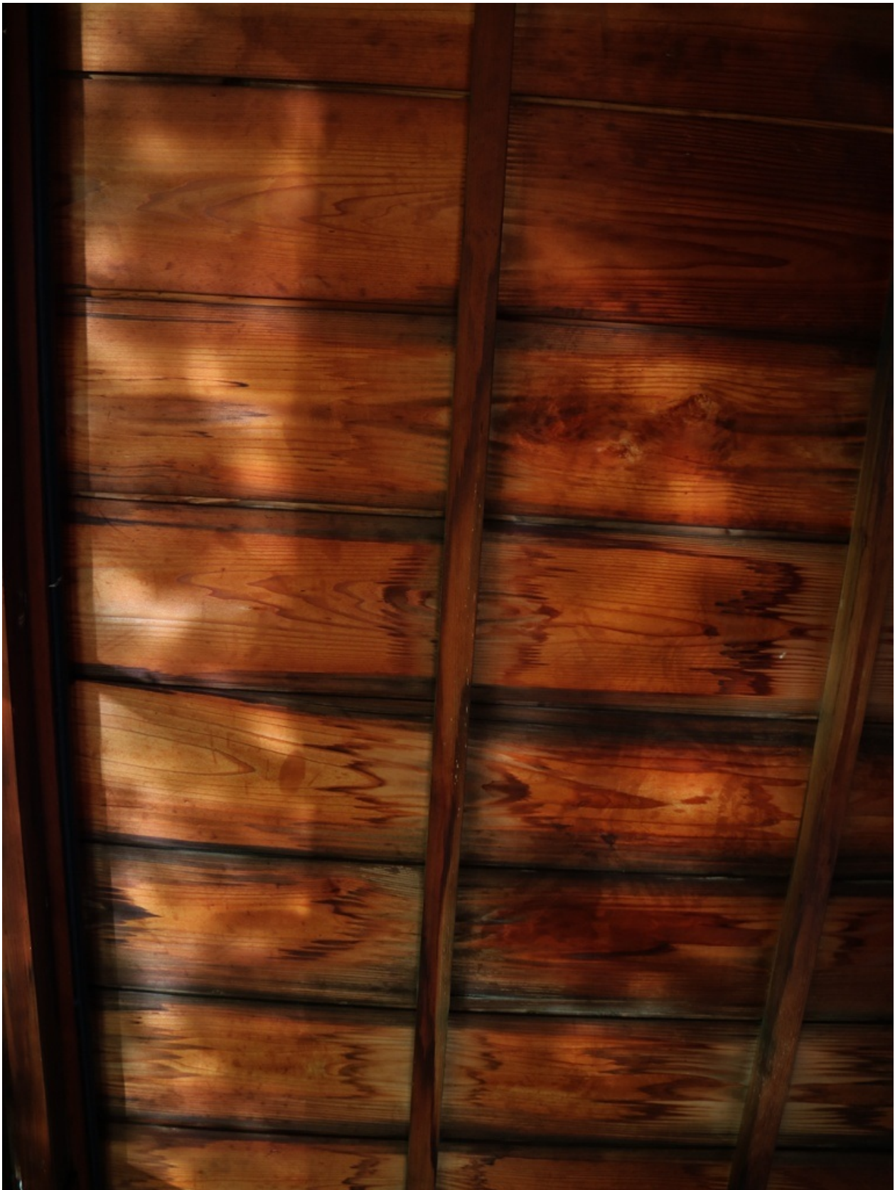
中庭の水泉の光が天井にゆらゆらと映っています。