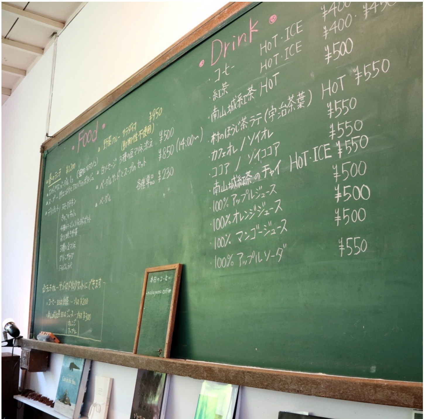
こんな勉強だったら楽しいよねきっと。