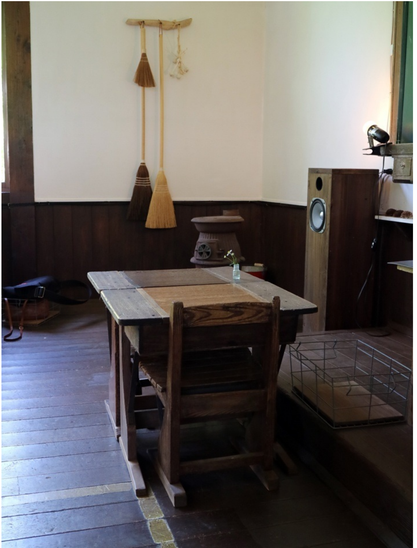
二人がけ席。おそらく小学三年生まで。 だけど大人も小さく座って食事をします。