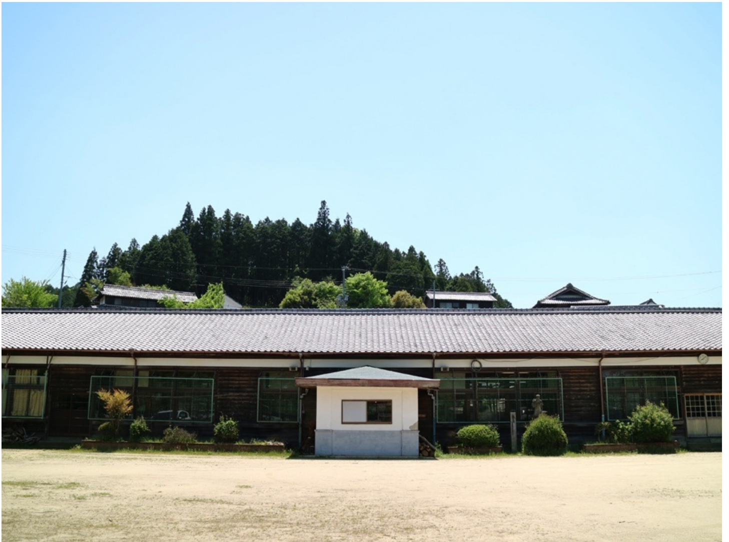
相模郡南山城村 旧田山小学校

山、谷、森のワインディングロードは、クルマ1台分の道幅しかなくて 楽にはすれ違えない。予定よりは1時間以上もオーバーして ようやく付きました。 木漏れ日と、森の緑は美しかったんだけども。