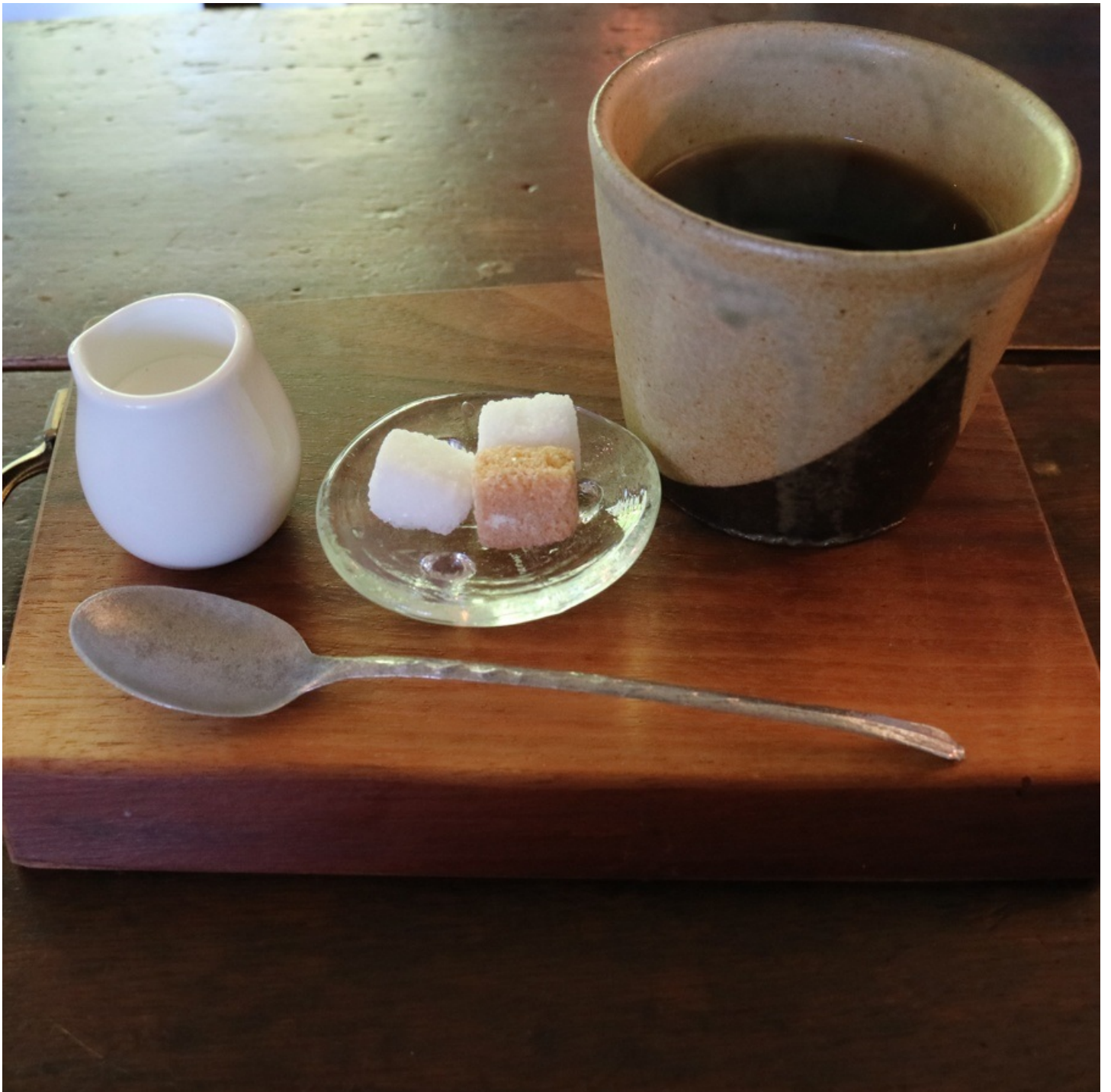
廊下側にも四人がけが二組。 これは追加で頼んだコーヒー。 お盆がいちいち面白い形をしている。