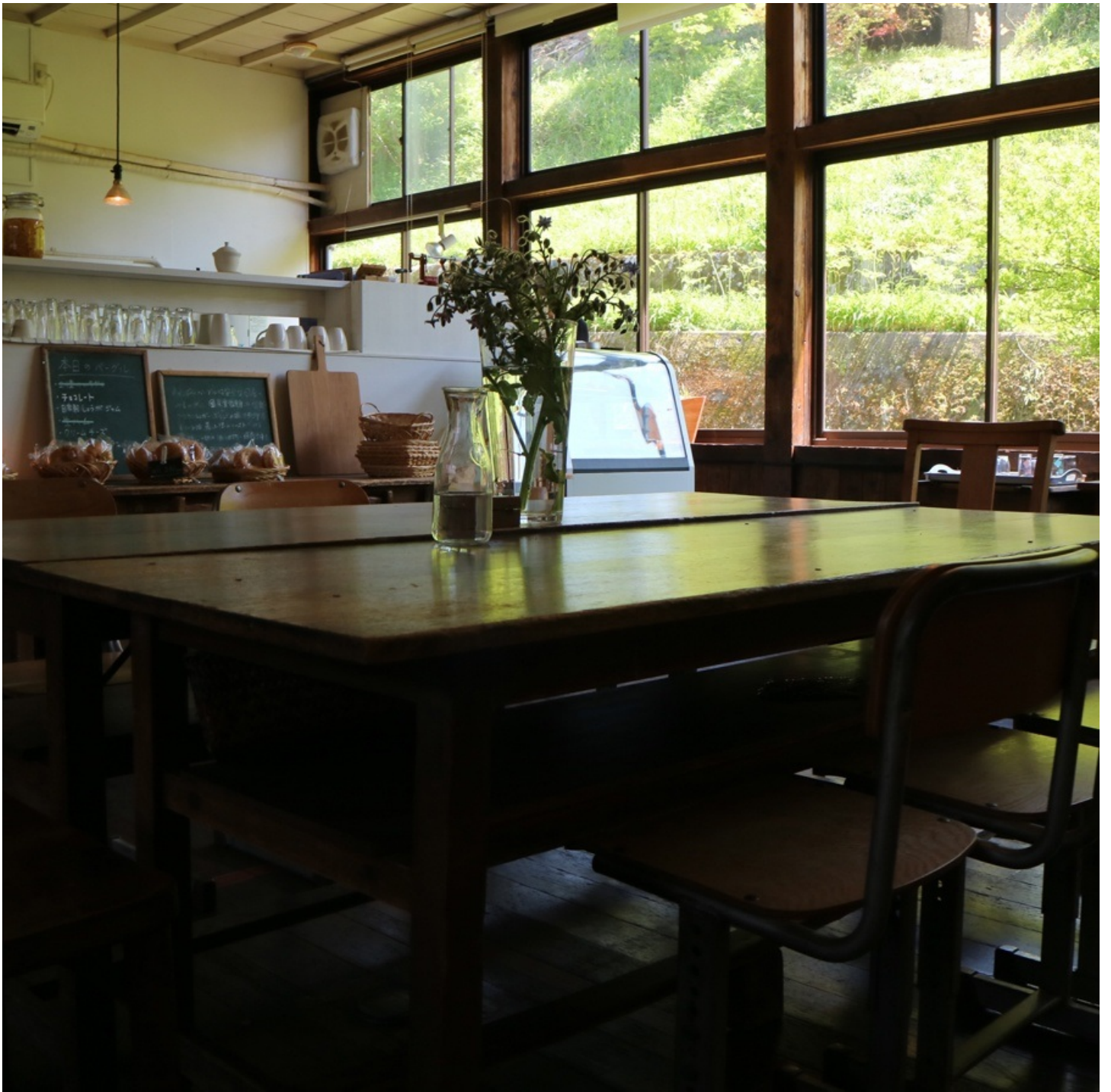
中央に八人がけ席。