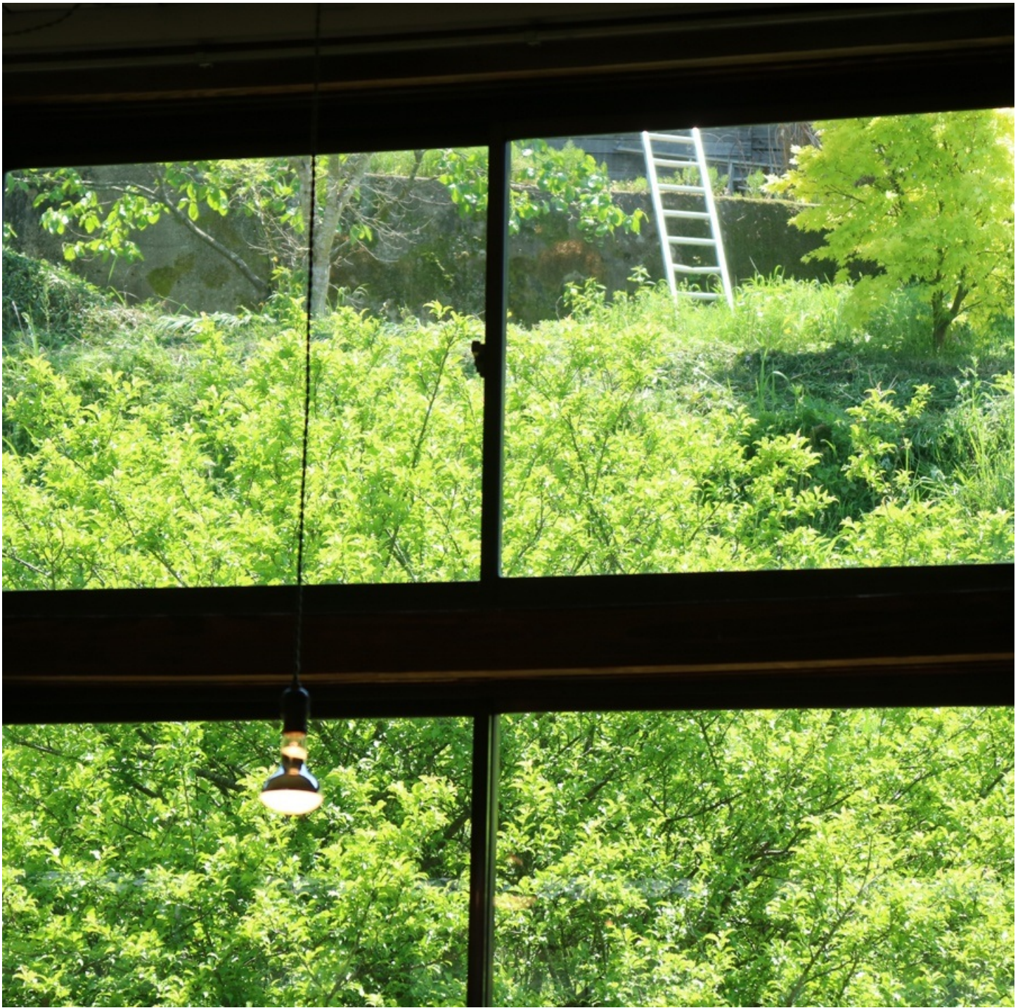
校舎の裏は斜面。 その前の緑は梅の木。三月にはきっと、窓一面に梅の花。