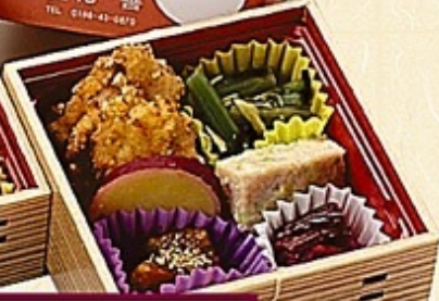
鶏めし玉手箱 525円(税込)