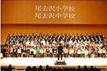
尾去沢小学校 尾去沢中学校

の響く学校」については、小中連携で力を注いでおり、毎年、11月の鹿角音楽祭では、「刻の翼」という曲を小中合同で発表しています。三つ目の「地域に元気を発信する活動」については、5月の地区の祭典「山神社祭」に全校児童で参加し、保育園・小学校・中学校・地域合同による、「かなやまソーラン」を地区のメインストリートで踊ったり、6年生が修学旅行(函館市)で、5年生が自然体験学習(八峰町)で、「かなやまソーラン」の披露や自作パンフレットの配布等を行ったりして、「尾去沢をPRする活動」に取り組んでいます。その他、尾去沢市民センターのサークル会員との定期的な交流や子どもによるブログ配信等を通して、ふるさとキャリア教育にも力を注いでいます。鹿角に来た際には、ぜひ尾去沢地区にお立ち寄り下さい。