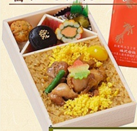
鶏めし弁当 880円(税込)