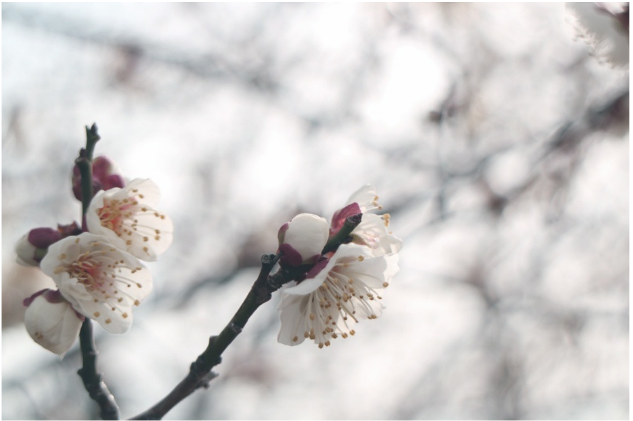
梅が開花 2ヶ月ぐらい早いのでは。