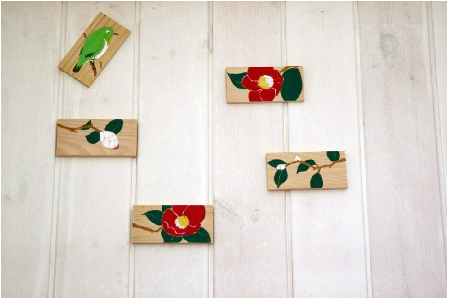
キッチンの壁に貼って出来上がり。