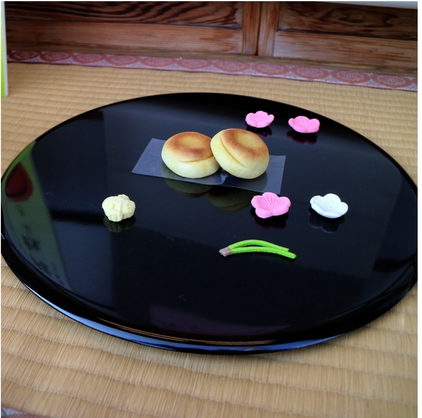
京都らしい、しっとりとした正月風景もどうぞ。