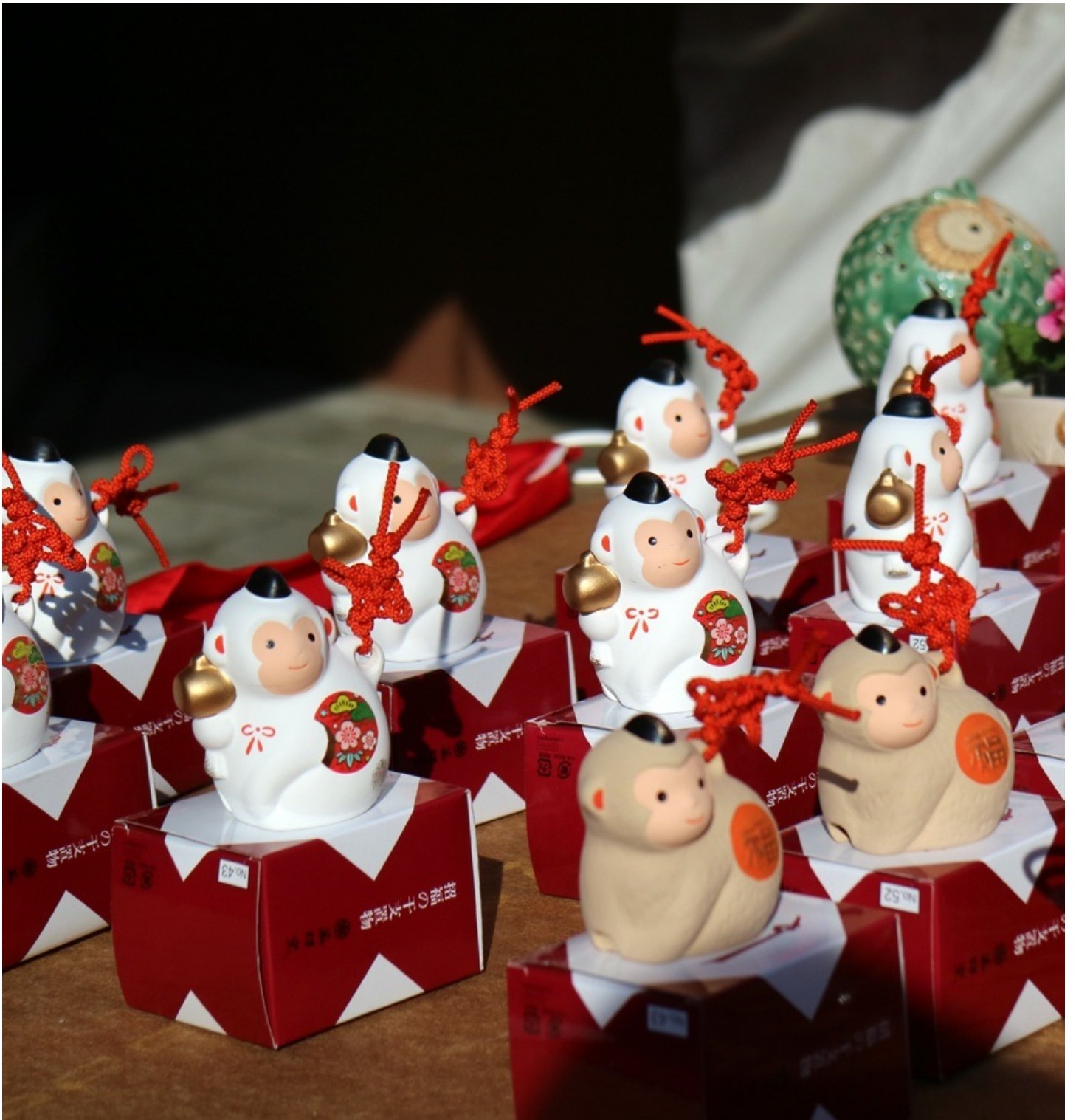
夏びす神社の外に出ました。 可愛いなあ。