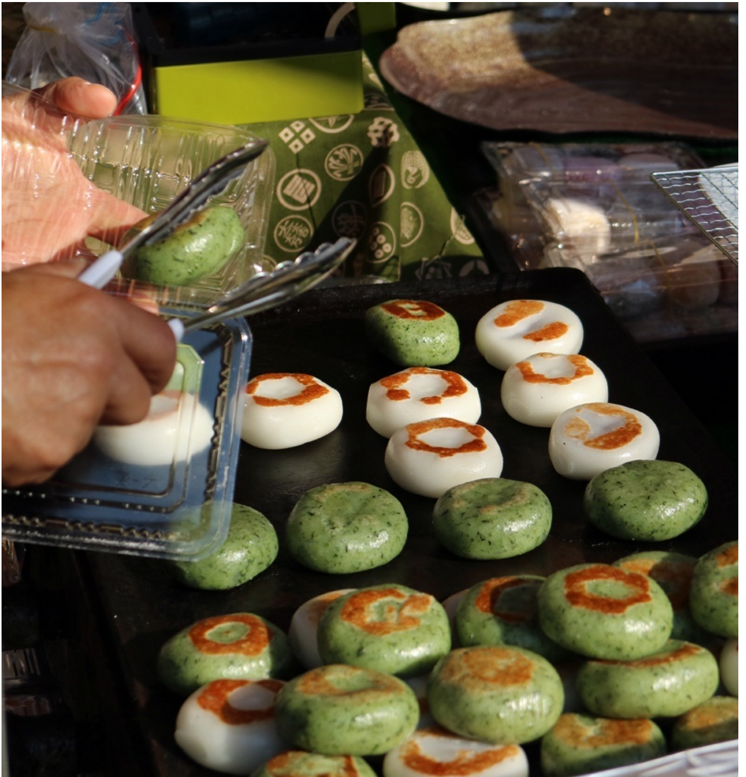
んーん、コロコロしてて可愛い。