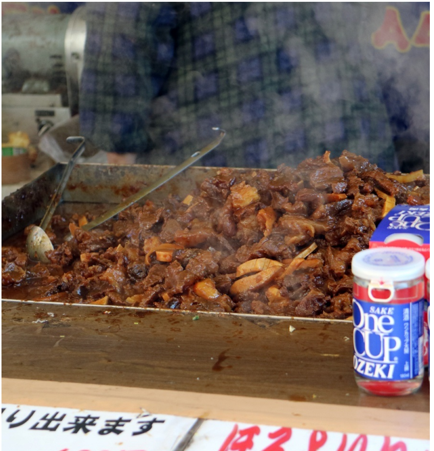
土手焼きにカップ酒。 私の苦手な組み合わせです。