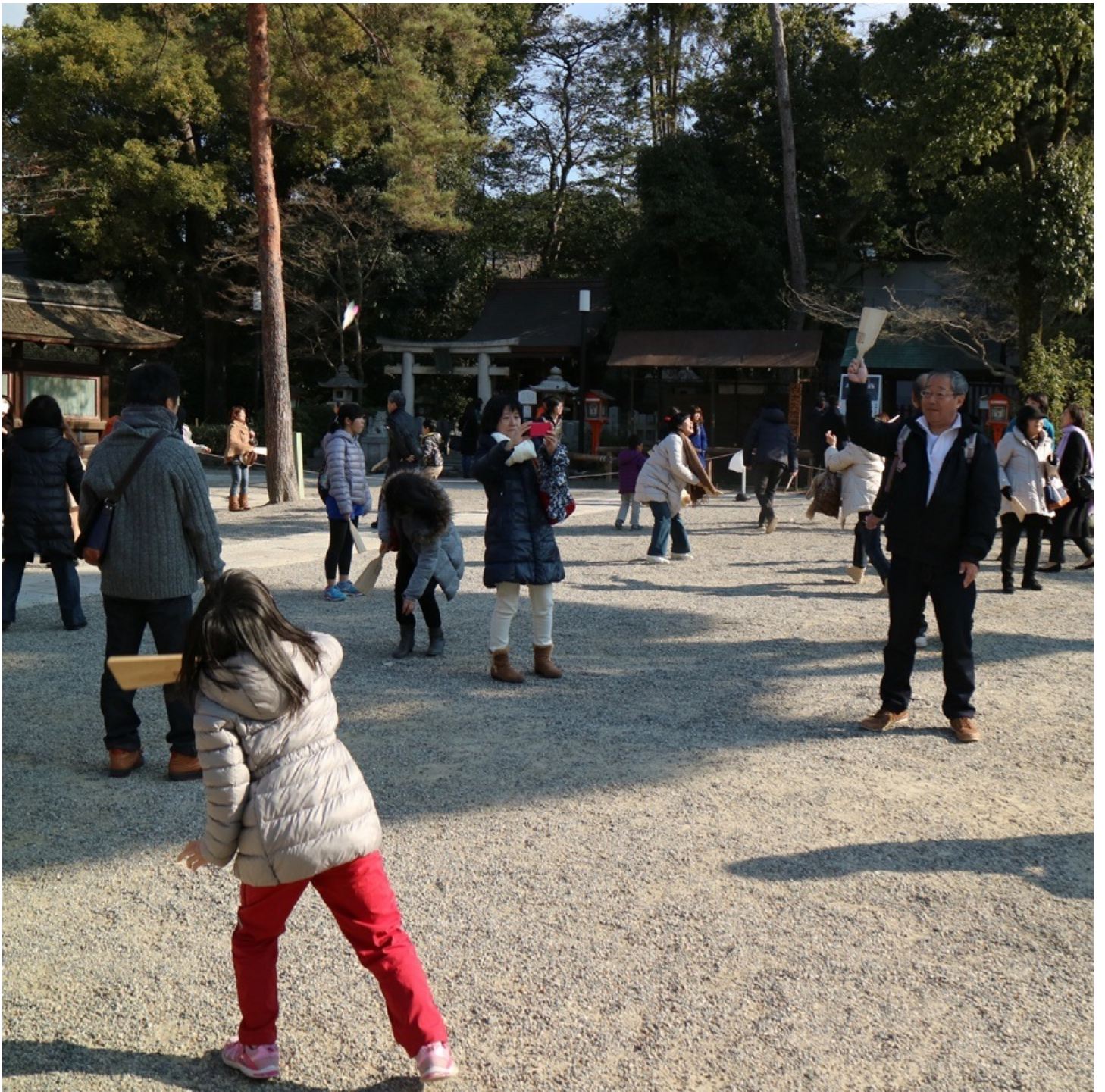
羽根つき大会やってました。 日本選手権とかじゃないので参加自由です。