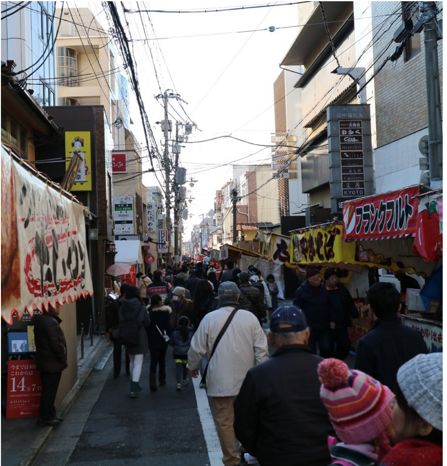
四条通り（東西）から大和大路通り（南北）を下ります。 10:00頃なんですけどもうこんな人出です。 これが500mばかり続きます。