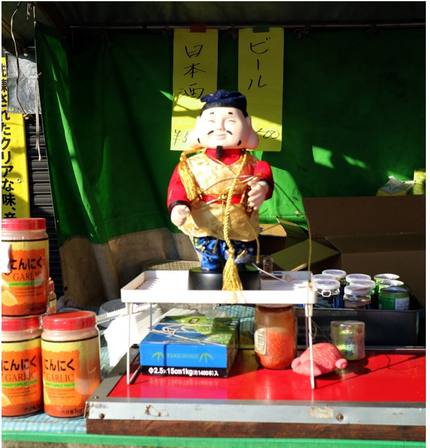
踊るえべっさん。 どっかで見たことあると思ったら、 クリスマスの頃は赤い服に白ひげで踊ってました。 動きが全く同じ。