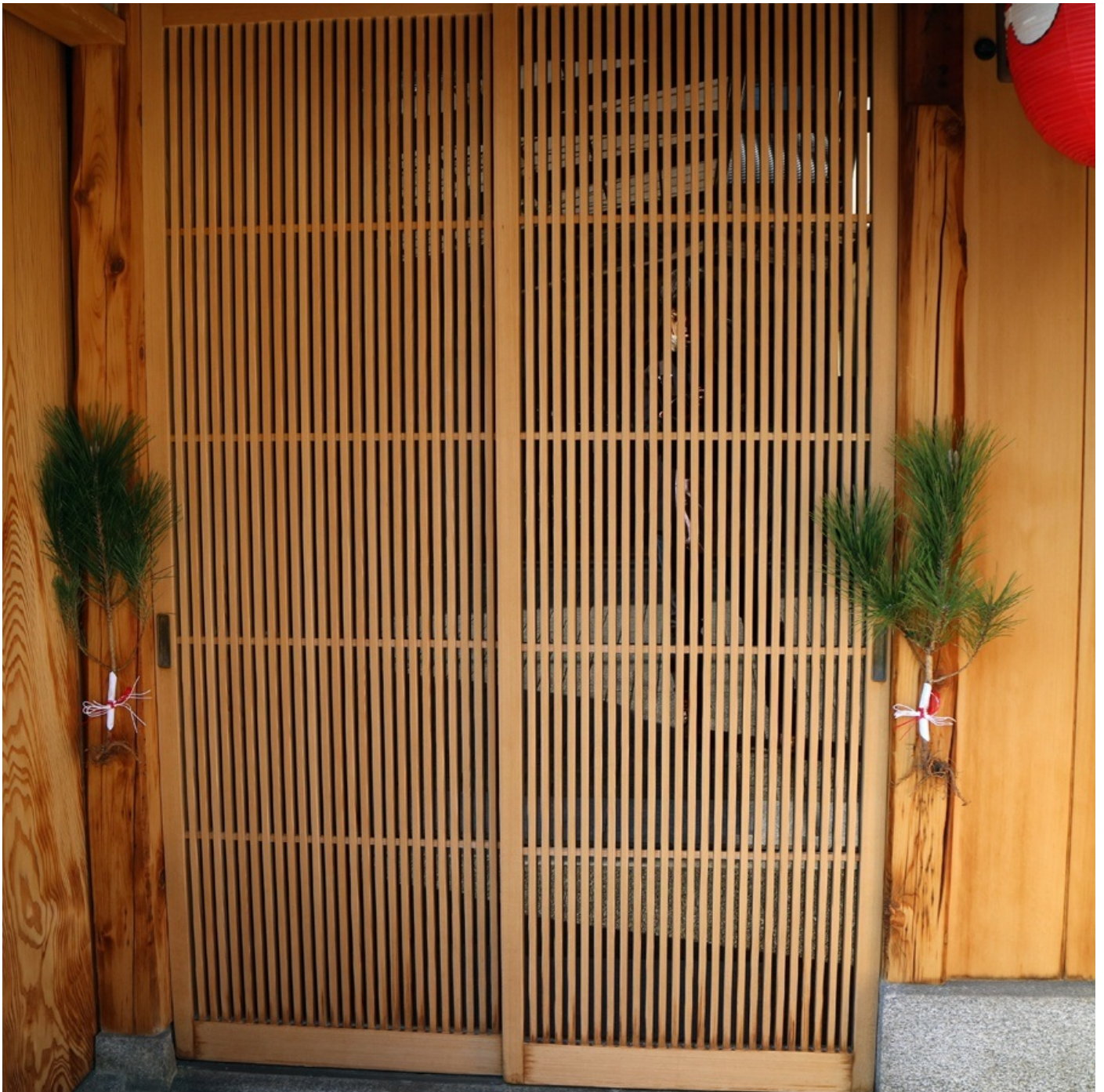
関西では、玄関に雄松と雌松を飾るのが昔からのやり方です。