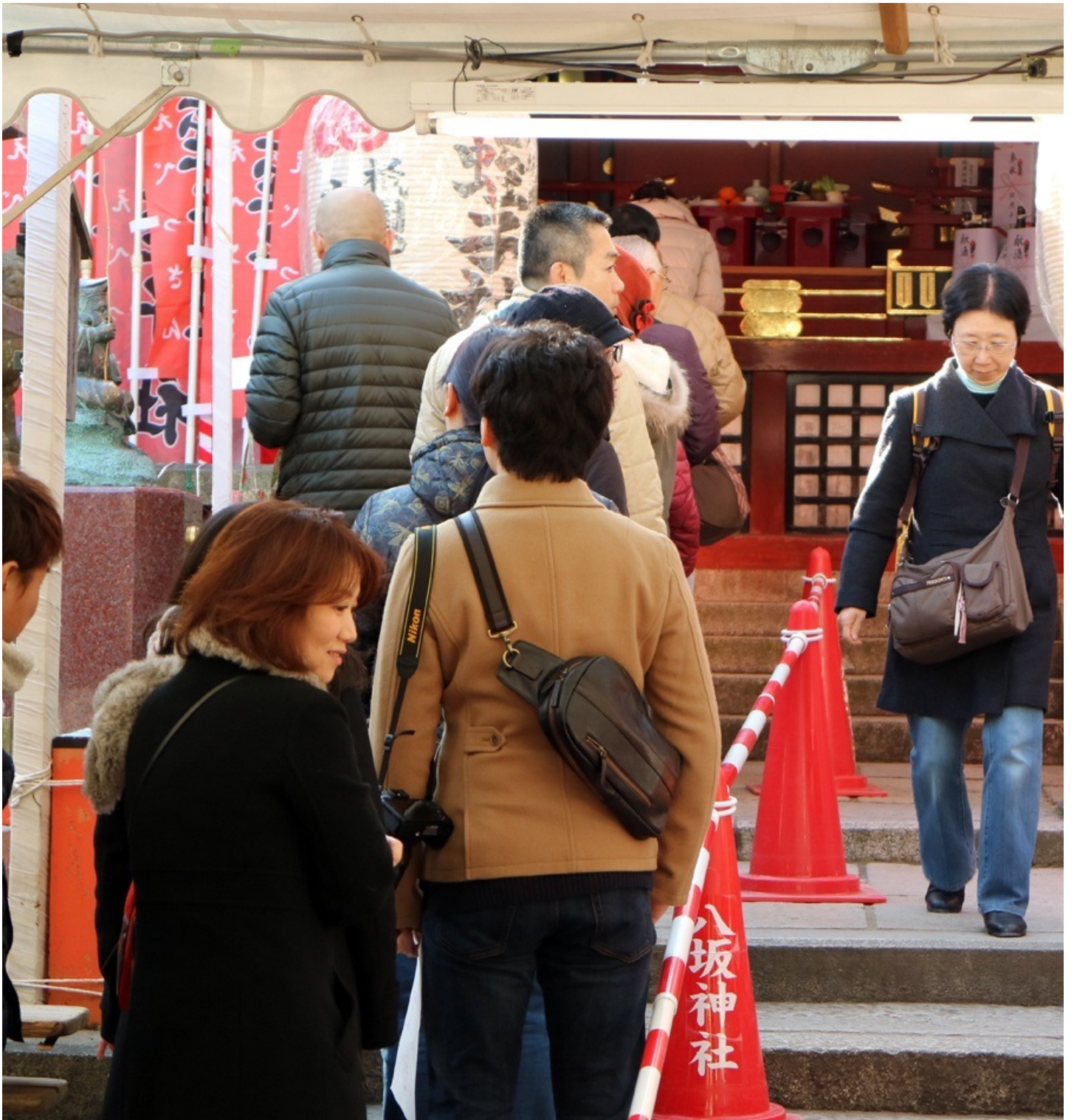
赤いコーンに八坂神社。特注品でしょうか。 赤白のバーも初めて見ました。