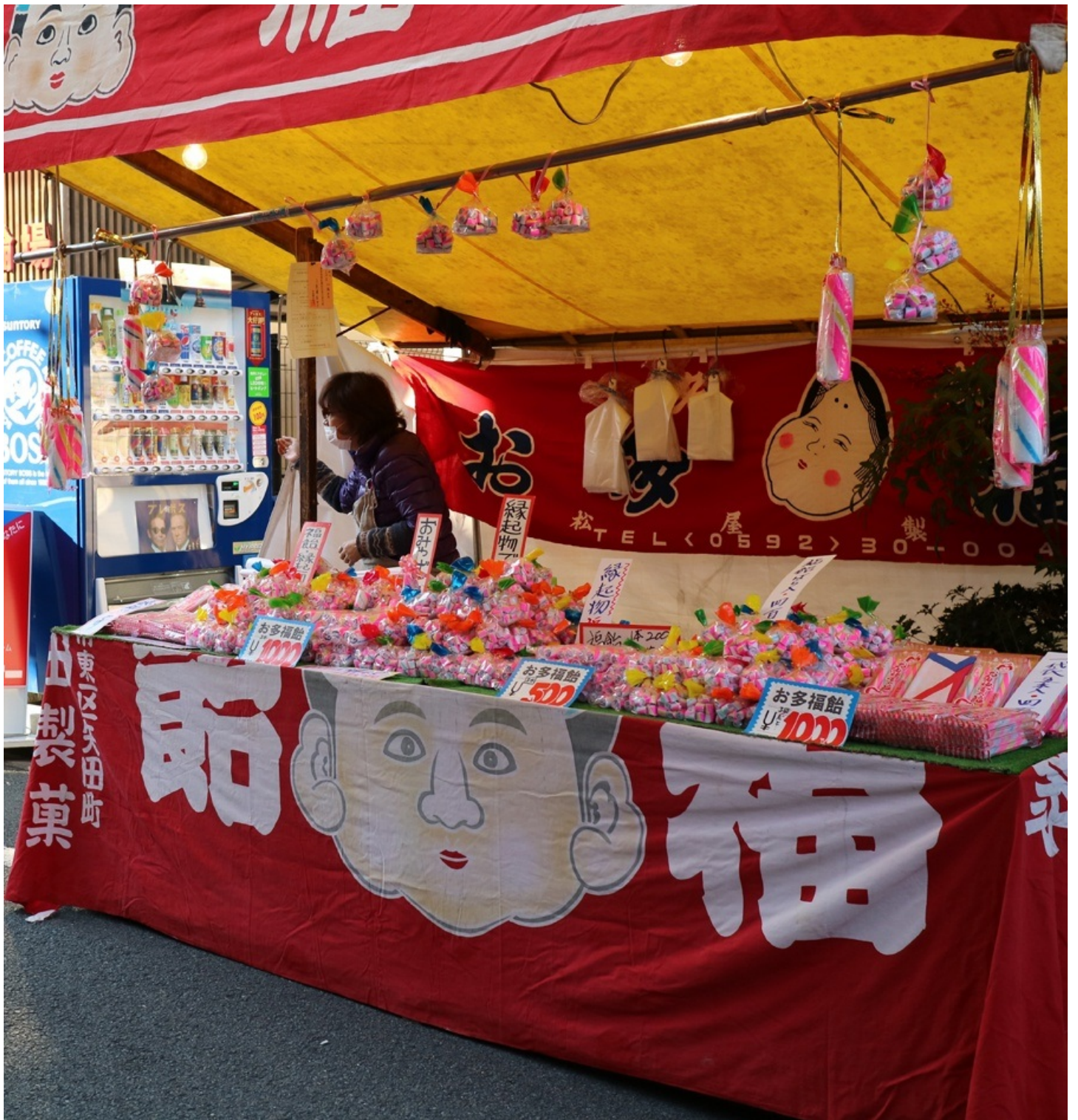
いわゆる金太郎飴 えべっさんでも出てきはるんやろうか。