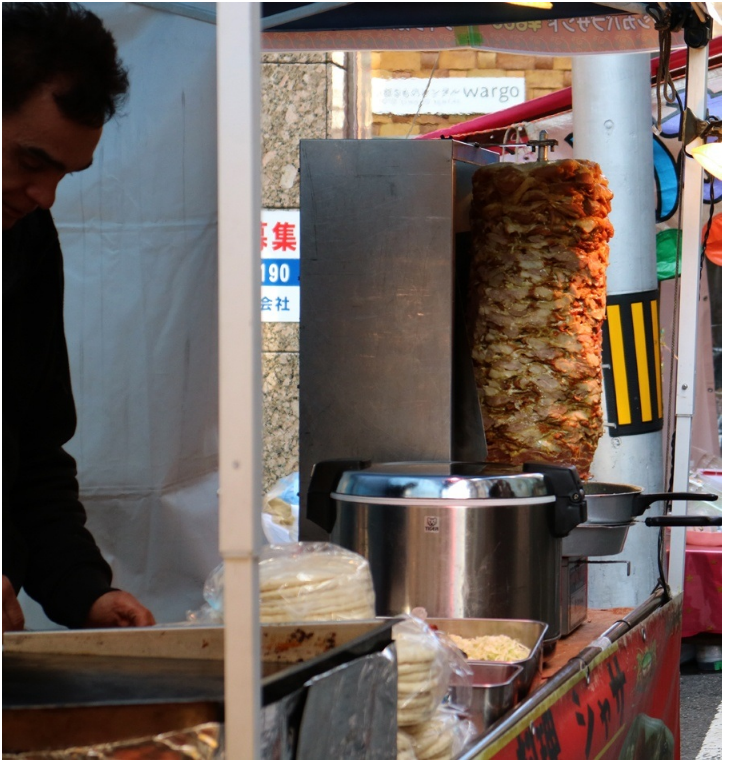
ケバブか。新しいなあ。 もっと世界中の屋台が出ればいいのに。