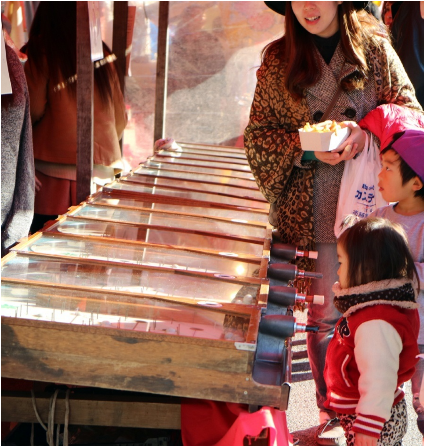
スマートボールですが、台が年季を感じさせます。 この子は、まだようわかってないようですね。