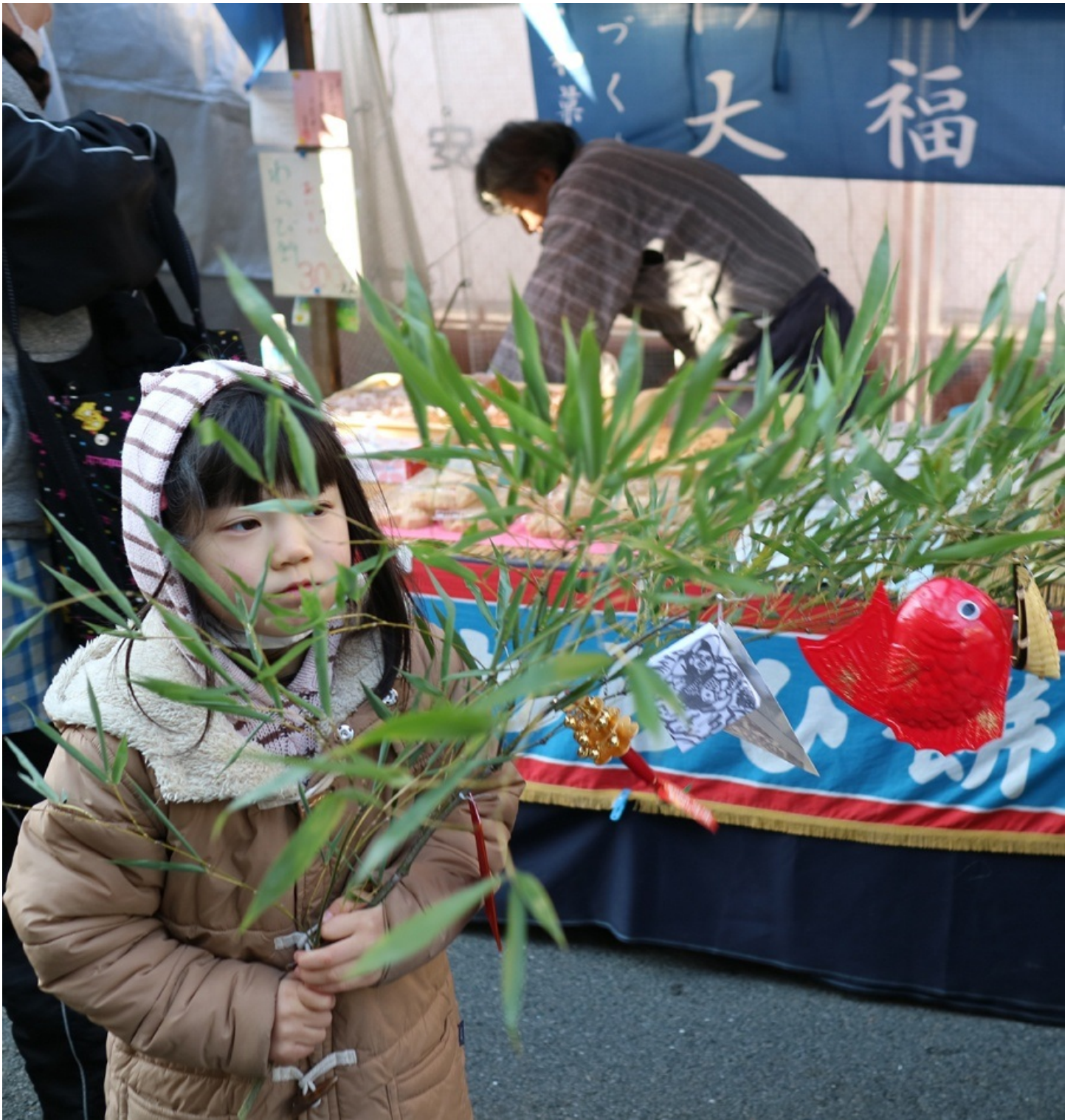
鯛やら鈴やら箕やら いっぱいつけてるね。