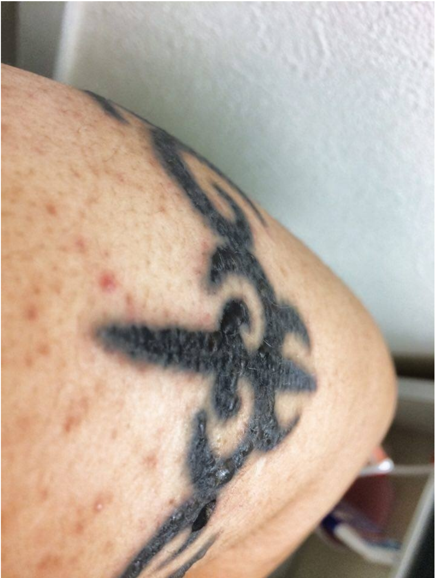
こちらは左腕でイースナイザーで施術したものです。