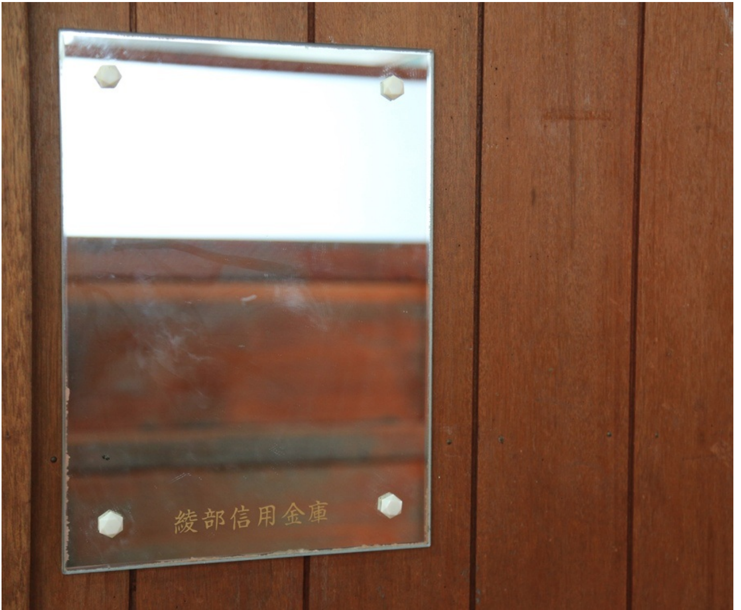
この学校、鏡が多い。