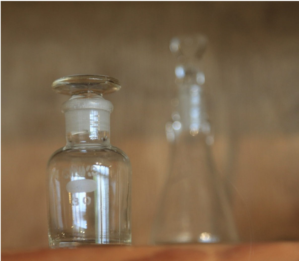
これは薬品瓶かな。使ったことない。塩酸とか入っていそう。