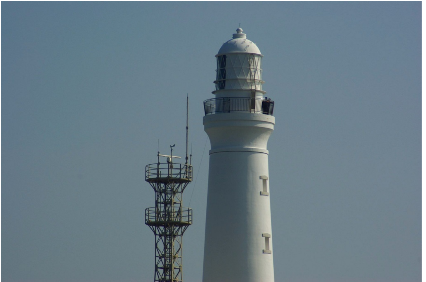
日本に五つしか現存しない、最大級のレンズを使用した、第一等灯台です。