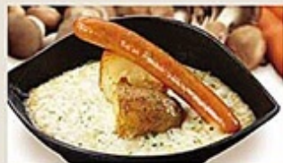
焼きチーズ de ジャーマンソーセージ ¥299 (税 ¥322) 200g/個 ¥17g