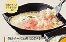
焼きチーズ de 明太子 ¥299 (税 ¥322) 200g/個 ¥17g