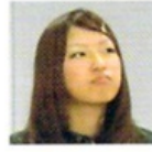
ぽっくる 武蔵大2年。地元は北海道札幌市。