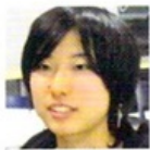
キノ 女子美術大3年。吉祥寺で実家住み。