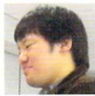
ターボ 大東文化大4年。千葉出身、一人暮らし。