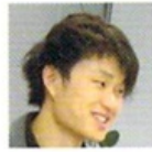
えっちゃん 首都大学東京2年。千葉から通学中。