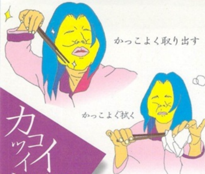
かっこよく取り出す

お箸にはたくさんのマナーがあるそうで、 そこまで気を配れている人は、 中身もしっかりした人、 そういうところで 人間性を判断されるのです。 逆にそれが出来れば、 ズバリ、モテますね。 ここで差をつけよう！ 目指せお箸美人！！