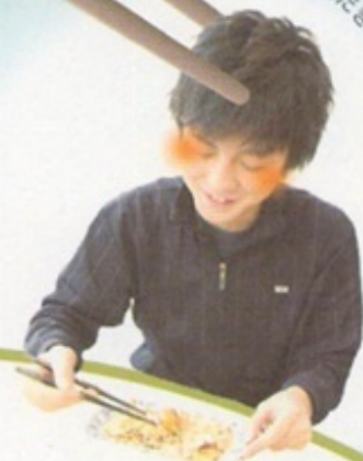
chopsticks mini pouch

さて皆さん「マイ箸」で、どんな幸せつかもうか？ ごはんにする？オシャレにする？ それとも…あ・し・た？