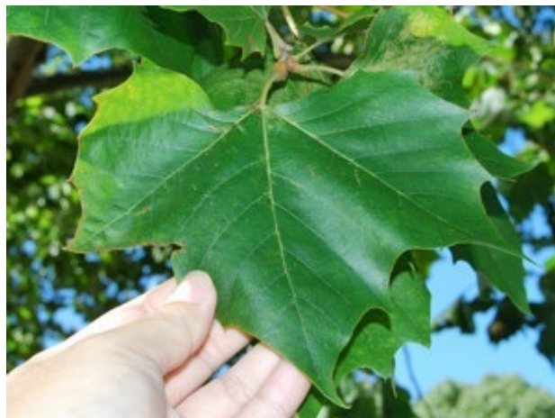
スズカケノキの葉表

スズカケノキ【鈴掛の木】 名前の由来は、山伏が着る衣装「篠懸(すずかけ)」には鈴玉のような房がついていて、それに似た果実をつけることから。街路樹としてよく植栽される。プラタナスとも呼ばれる。 花期は4～5月 Platanus orientalis {スズカケノキ科スズカケノキ属／落葉高木}