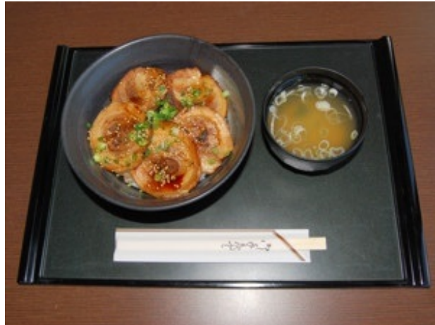
焼き豚丼(レイクサイド・レストラン)