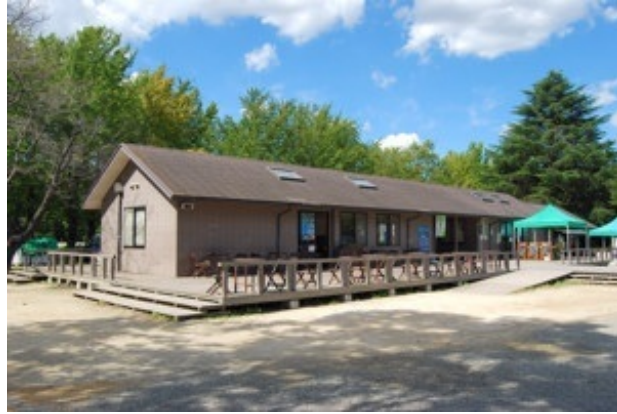
バーベキュー・ガーデン