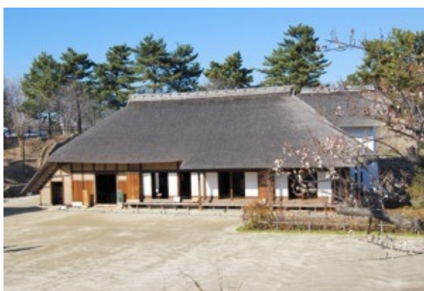
古民家(こもれびの里)