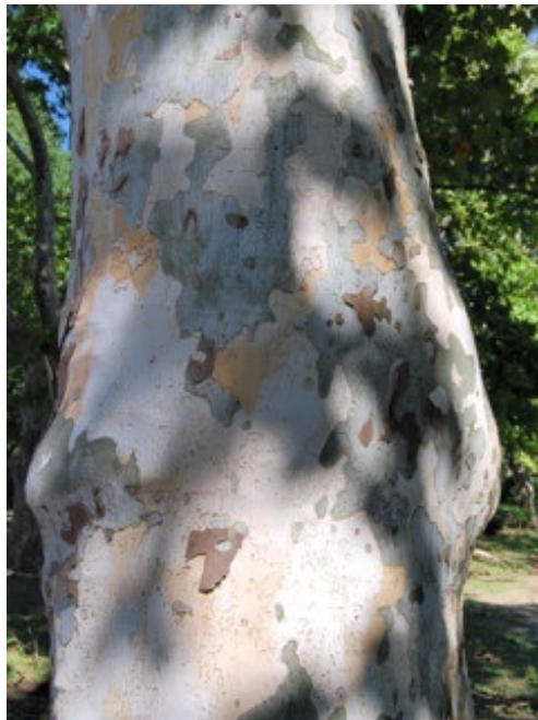
スズカケノキの幹