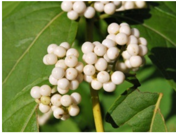
シロシキブ(日本庭園・10月) ムラサキシキブの実が白い園芸品種です。