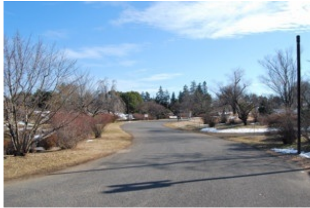
こもれびの池付近