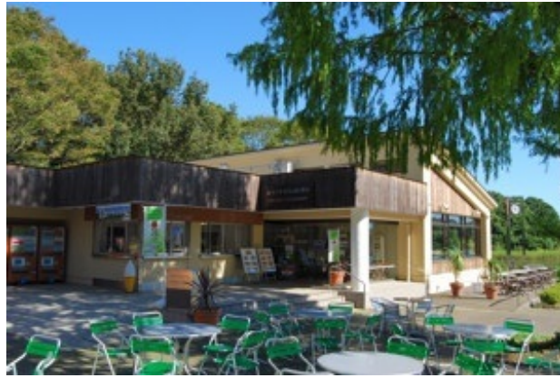
レイクサイド・レストラン