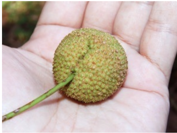
スズカケノキの実