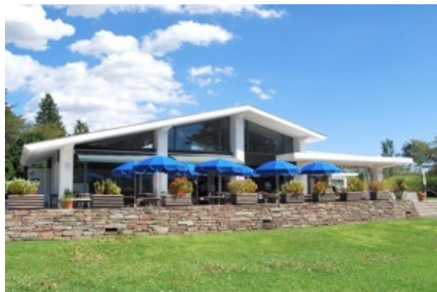
ふれあい広場レストラン