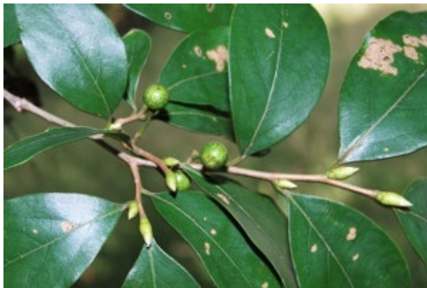
ヤマコウバシ【山香ばし】 花期は4～5月 Lindera glauca {クスノキ科クロモジ属／落葉低木}