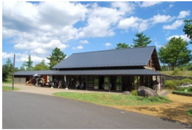
こもればの里・休憩棟