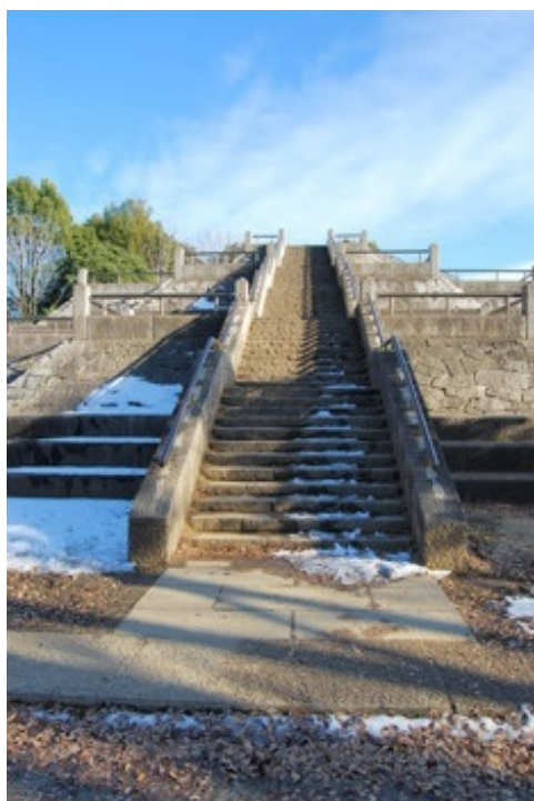
太陽のピラミッド