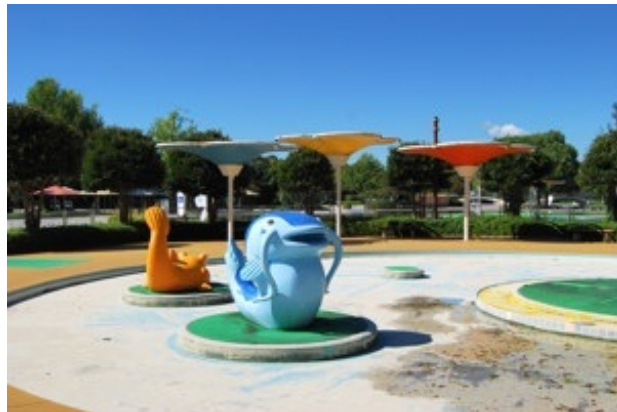
レインボー・プール