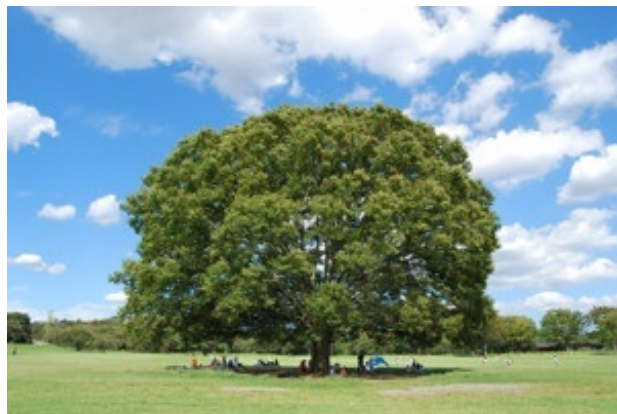
大ケヤキ(みんなの原っぱ)