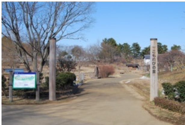
こもれびの里入口