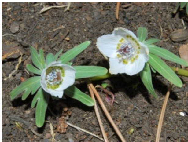
セツブンソウ(こもれびの里休憩所付近)