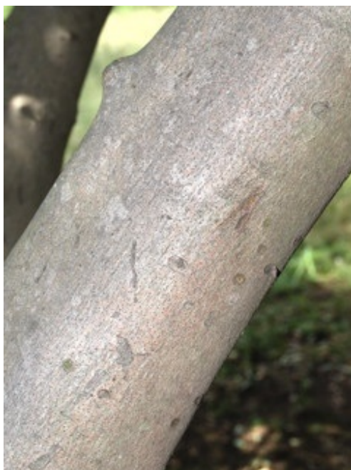
ヤマコウバシの幹