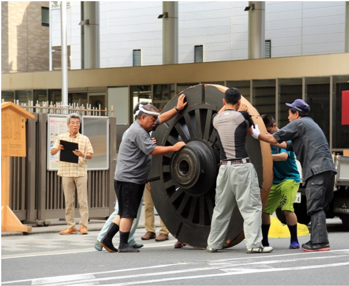
倉庫から車輪を引っ張り出してきて