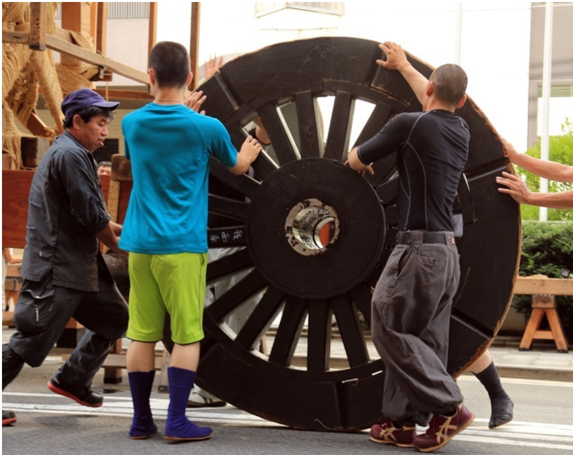
ゴロンゴロンと転がして、