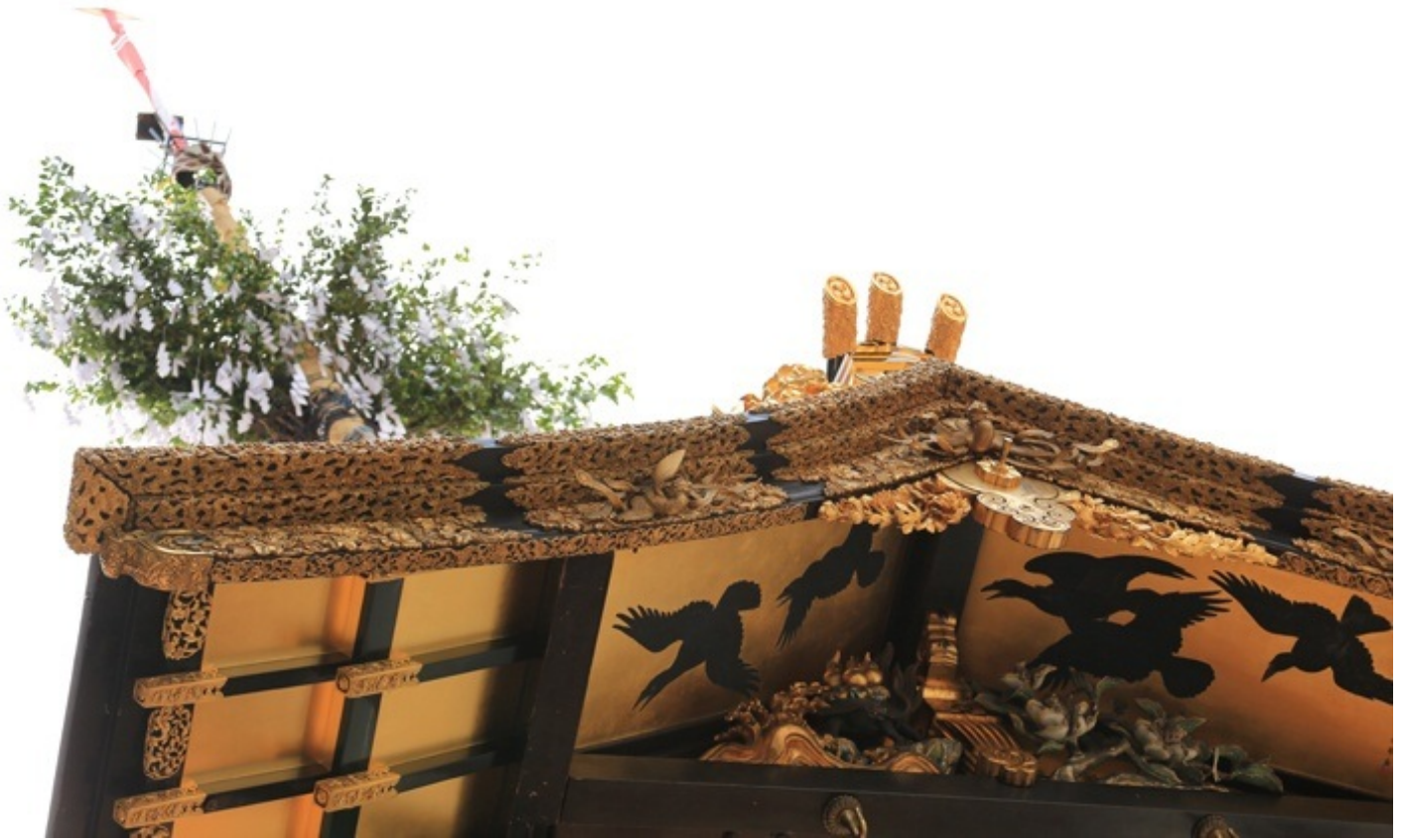
軒先までこの通り。動く美術館とはよういうたもんです。