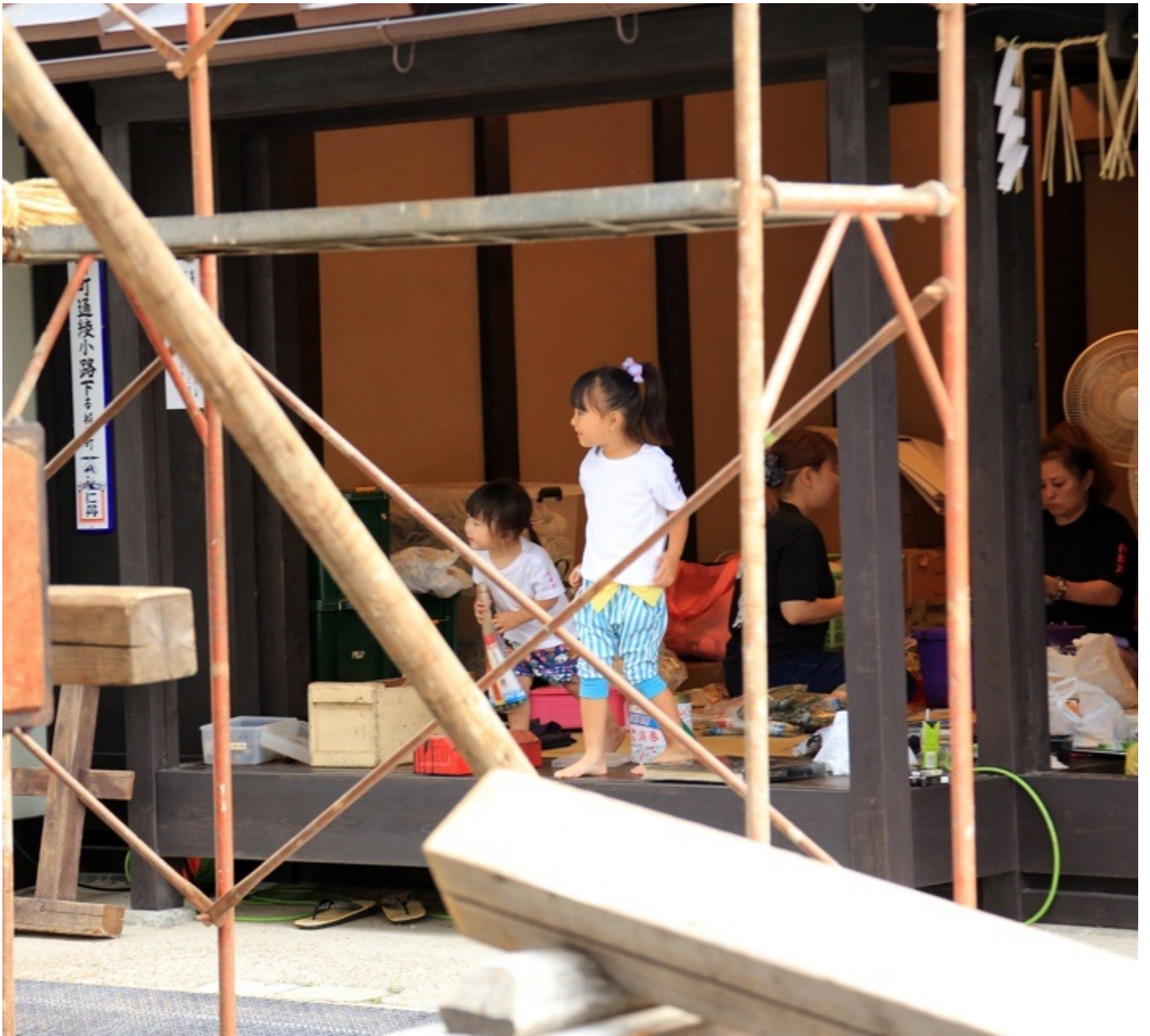
お手伝いのお嬢ちゃんたち。 かわいい。