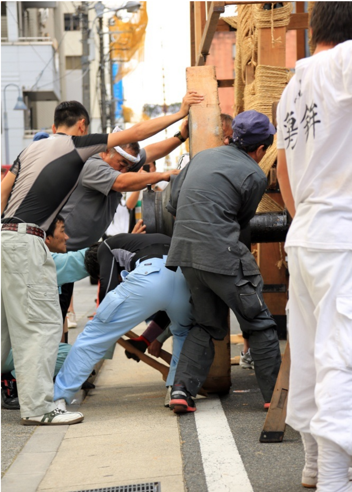
横からはめる。この右側では十数名の男衆が 体重を乗せたテコで車軸部分を持ち上げています。