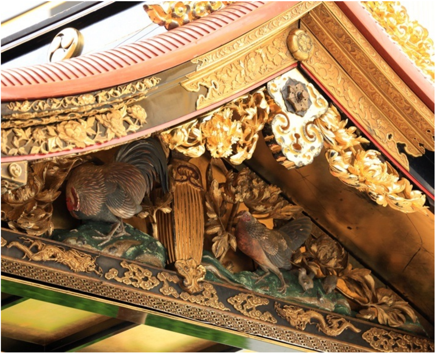
こっちは鶏鉾。天井金箔ですね。