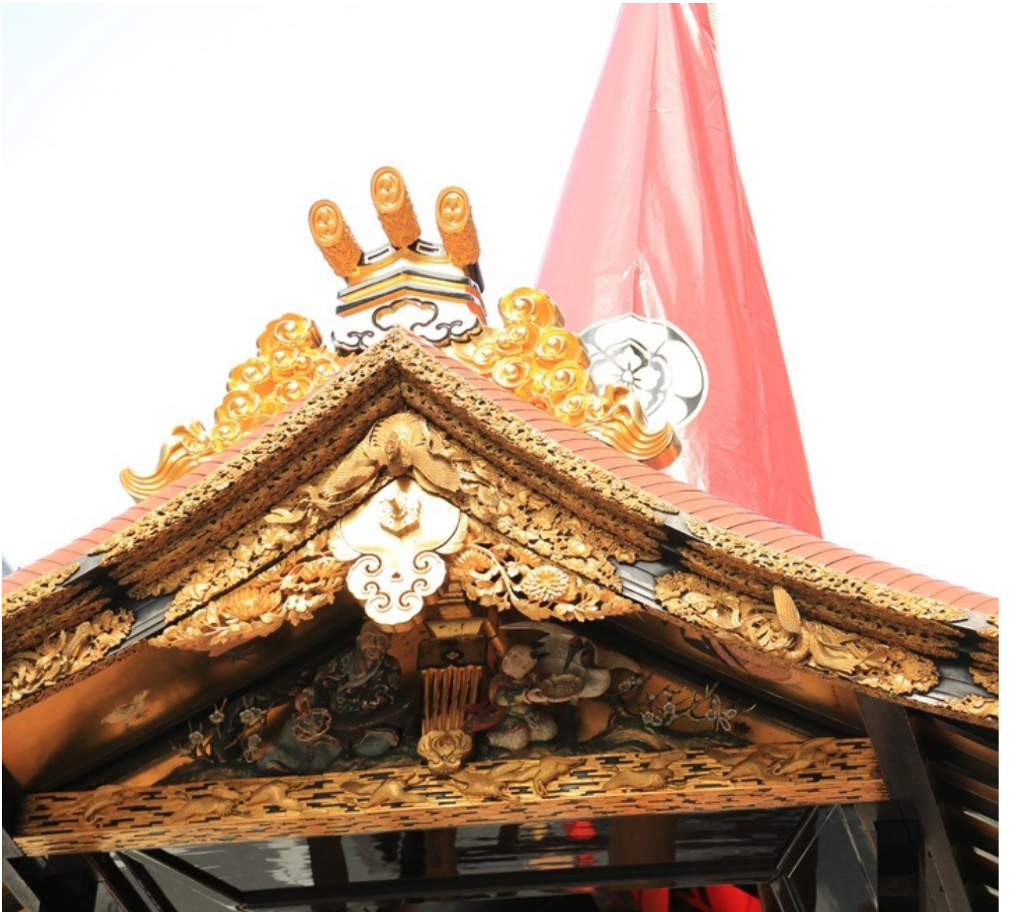
天井は漆の黒でつやつや。 そして二条城の唐門がそのまま出てきたかのような稠密な飾り。